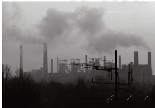
Testiranje kakvoće zraka u okrugu Radvanice – Bartovice Oznake su sa visokom razinom zagađenja.

projekte u 2004 godini. Uključena je shema zaštite zemlje i podzemnih voda, i projekt za poboljšanje kakvoće otpadnih voda, koji je dovršen tijekom godine. 2006 godine su završene rekonstrukcije i nadgradnje kotla, koji je također smanjio SO 2 emisije u željezari, i napravljene su promjene u sistemu pročišćavanja otpadnih voda.