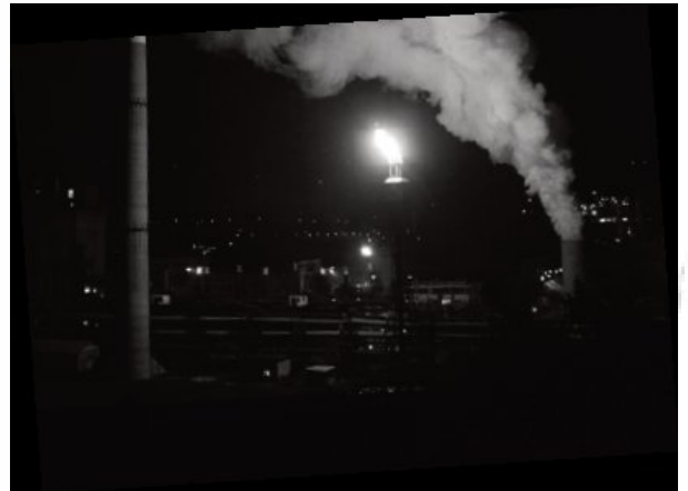
Operacije Arcelor Mittal Zenica

pažljivo od strane preduze a s obzirom da 49% preduze a još uvijek 'drži' vlada Republike Srpske ija se uloga u spomenutim doga ajima ne može isklju iti.