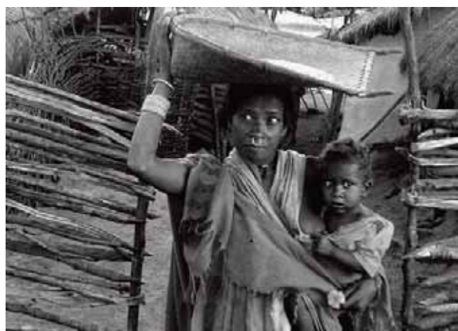
Prebivalište u Orissi

Tražena zemlja za projekt je žitorodna, plodna i navodnjavana. Ljudi su glasni te je vjerovatno da neće odustati od svoje zemlje tek tako, što će biti problem za oboje, vladu Orisse i Mittal. Orissa je pretežno poljoprivredna država gdje skoro 70% radnog stanovništva ovisi od poljoprivrede. Program Ujedinjenih naroda za razvoj (UNDP) kaže, da je u Orissi nekih 100.000 porodica raseljenih od indijske nezavisnosti 1947 godine, i oko 2 milijuna pogođenih na različitim novoima, zbog razvojnih projekata.