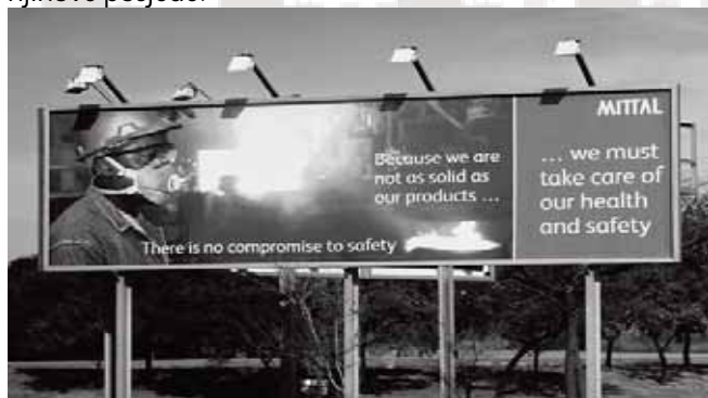
ArcelorMittal u Vanderbijlparku nema kompromisa kod sigurnosti ...

U trenutku kad ga je Mittal kupio, aparthejdovski gigant ISCOR je već bio uznapredovao u borbi protiv lokalne zajednice 'Željezne doline' koju je zagađivao preko 40 godina. Željezara, izgrađena neposredno nakon 2. svjetskog rata izlivala je svoju otpadnu vodu u nezaštićene brane, zagađujući i tako ponomicu iz koje je stanovništvo 'Željezne doline' crpilo vodu za piće. Otpadna voda je također ispuštana u nezaštićeni kanal iz kojeg su zemljoposjednici, koji su posjedi graničili s kanalom, crpili vodu za navodnjavanje i rekreaciju. Kod stanovništva Željezne doline povećao se broj zdravstvenih problema (npr. karcinom), a što je dalje negativno uticalo i na njihove aktivnosti na farmi. Stanovništvo se angažovalo u administrativnoj i sudskoj borbi protiv giganta ISCOR-a koji je već dio njih zapošljavao. U velikom broju slučajeva ISCOR je uspio postići i vansudsko poravnanje i to tako što je snabdio vodom male zemljoposjednike koji su bili 'na udaru', pod uvjetom da prethodno potpišu dokument u kojemu daju svoju saglasnost da se to pitanje smatra zatvorenim. Nakon toga je uslijedila vansudska nagodba u kojoj je ISCOR otkupio njihove posjede.