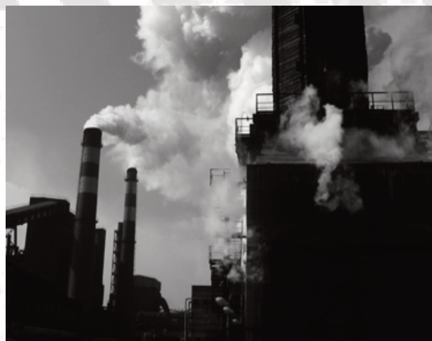
Sindikatski hitno zahtjeva brojna sigurnosna i zdravstvena i ekološka poboljšanja.

Osobni dohodak je bio predmet naporne borbe između sindikalnog odbora JSC "KryvorizhStal"-a i novog vlasnika. Uposlenici su izveli povremene proteste usljed odbijanja Mittala o povećanju plata metalurških radnika. Samo zbog intervencije državnog imovinskog fonda »13 plate« za 2005 godinu, radnicima je isplaćeno krajem 2006 godine. Potpisivanjem novog kolektivnog ugovora za 2007-08 godinu, činilo se da ga je sindikat pozitivno ocijenio. Prema godišnjem izvještaju za 2004 godinu. »Mittal Steel ne prihvata bilo koje ozljede na radu kao dopustljive i neminovne. Nova doktrina je jasna, da se sve nesreće mogu spriječiti, i da su radna mjesta bez ozljeda moguća.« i »Stopa ozljeda na radu se je poboljšala za 15% u 2005 godini u poređenju sa 2004 godinom«.