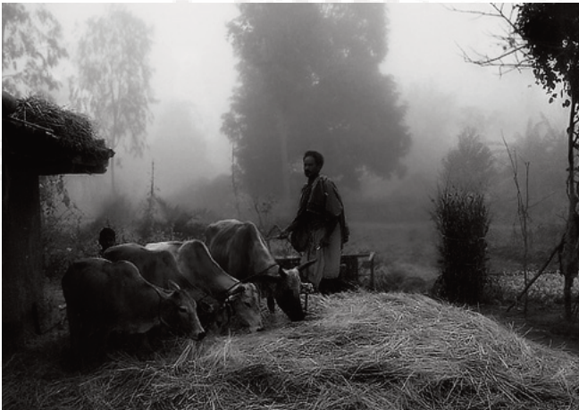
ArcelorMittal sije željezo na poljoprivrednom zemljištu u Indiji

Indijski političari su većinom podržali stjecanje Arcelora, druge najveće kompanije za proizvodnju elika u 2006 godini. Ministar trgovine Kamal Nath pisao je da se je EU prepirala oko stjecanja. Premijer Manmohan Singh je zaključio ovo pitanje prilikom posjete francuskom predsjedniku, koji je u početku bio vrlo kritičan do ovog posla zbog predviđanja za ukidanje radnih mjesta u Francuskoj i u drugim dijelovima Evrope.