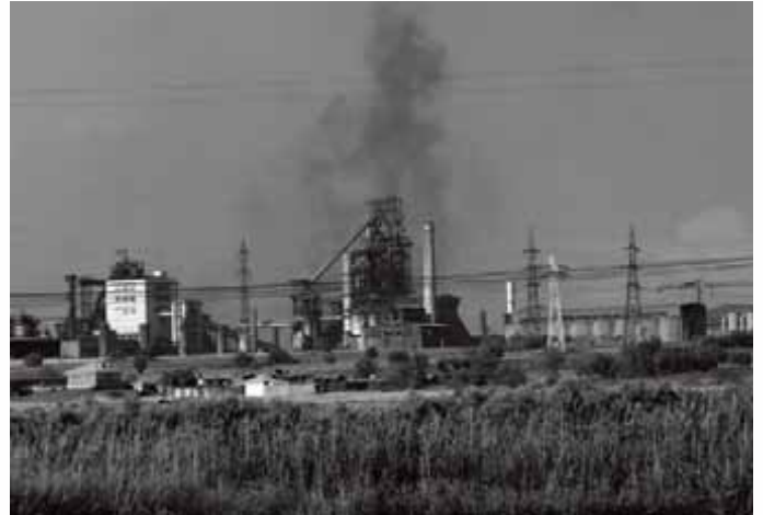
Ostaje još mnogo toga, da se smanji zagađenje u Galatiji.

Glavni problem za radnike nakon privatizacije željezare bila je prijetnja od otpuštanja radnika. Prema prodajnom ugovoru obavezno otpuštanje radnika bilo je zabranjeno za prvih pet godina nakon privatizacije. No, to nije zaustavilo otpuštanja u službama kompanije. Kao što je spomenuto gore, između privatizacije u 2001 godini i 2005 godine broj radnika je pao sa 25 000 na 18 000, sa planovima o otpuštanju dodatnih 5000 radnika.