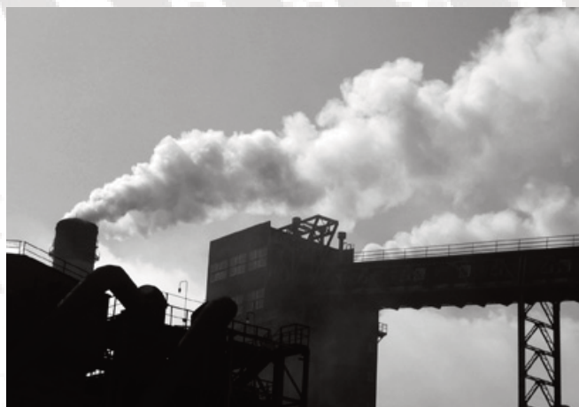
ArcelorMittal je glavni zagađivač u Kryviy Rih-u.

Javna aukcija za prodaju 93,02% dionica dioničkog društva "Kryvorizh-Stal" održana je u Kijevu 24. oktobra 2005. Mittal Steel Company Germany GmbH (Njemačka) pobijedio je na aukciji i za kompaniju je platio $4,8 milijardi. Novi vlasnik "KryvorizhStal"-a bio je dužan ispuniti niz uvjeta koji se tiču gospodarske aktivnosti, inovacija i ulaganja, kao i socijalne i ekološke zaštite.