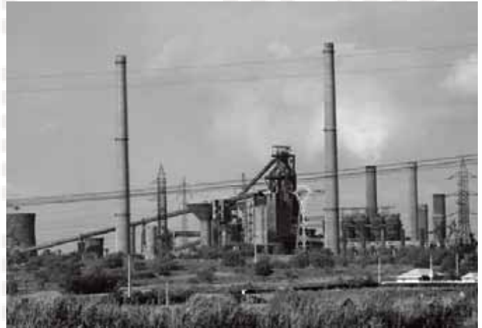
Iza hladnog vanjskog izgleda ArcelorMittal Galati postaje scena zagrijetih radničkih sporova posljednjih godina

Kako se navodno govori tvornica je u svom zenitu zapošljavala 47 000 ljudi, iako je do 2001 godine broj smanjen na 25 000. Do 2005 godine broj je pao na 18 000, s ciljem rezanja još 5000 radnih mjesta do 2008 godine.