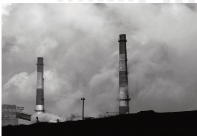
Rezultati ekoloških investicija još uvijek nisu jasni.

Ako EAP i zdravstveno sigurnosni pravilnik nisu dostupni javnosti i radnicima u kompaniji vrlo je teško suditi stanje njihove implementacije. U skladu s EBRD-ovom financiranom projektom u Kazahstanu – ArcelorMittal Temirtau, čak i osoblje ekološkog odjela nije bilo upoznato s detaljima akcijskog plana, i nejasno je da li je slušaj sa AMKR drugačiji.