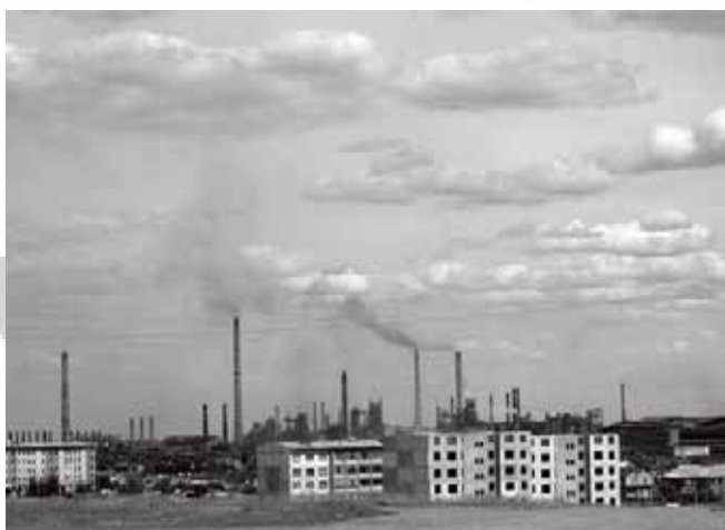
Uprkos kreditima, zaga enje koje uzrokuje Arcelor Mittal ostaje ozbiljan problem u Temirtau.

Mittalova ulaganja se esto interpretiraju kao «spašavanje» umiru ih ' elinih gradova' što je jako preuvelo ano s obzirom na složenost problema do kojih dolazi uslijed uspona i padova velikih željezara. Temirtau je grad sa specifi nim problemima, s velikim brojem stanovnika koje živi ispod linije siromaštva i velikim brojem nezaposlenih i ovisnika, te s ubjedljivo najvišim nivoom infekcija HIV-om (AIDS) u Kazakhstanu .