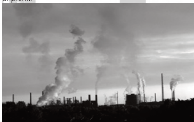
Ostravski zagađeni horizont.

U jesen 2007 godine, GARDE Program (Globalni savez za odgovornost, demokraciju i kapital) zajedno sa građanskim pravnicima Udruge za zaštitu okoliša započeli su pomagati stanovništvu pogođenom aerozagađenjem besplatnim pravnim savjetima. GARDE-ovi advokati pomogli su organizirati peticiju protiv neodgovornog ponašanja ArcelorMittala i državnih vlasti, koje je potpisalo više od 2.300 građana. Istovremeno, pravne akcije zahtijevaju pregled izdanih radnih dozvola, koje su posredovane nadležnim organima. I daljnje akcije su u pripremi.