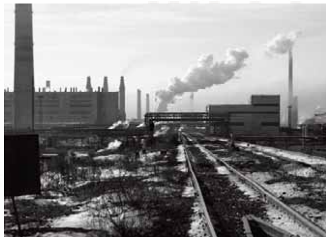
Lokalne NVO se nadaju da e im plan angažmana lokalnih relevantnih faktora pomo i da do u do informacija o zaga enju, zdravstvenoj situaciji i sigurnosti.

Javnost i dioni ari nemaju ni danas priliku prona ažurirane informacije o implementaciji projekta na EBRD-ovoj web stranici jer je ona ažurirana 1997. godine. Ažurirana informacija o projektu je postavljena na EBRD-ovu web stranicu tek 9 godina kasnije (od 2006. godine). Takva prepeka pristupu informacijama o teku im projektnim aktivnostima je suprotna EBRD-ovoj postoje ojoj okolišnoj politici ( lan 28).