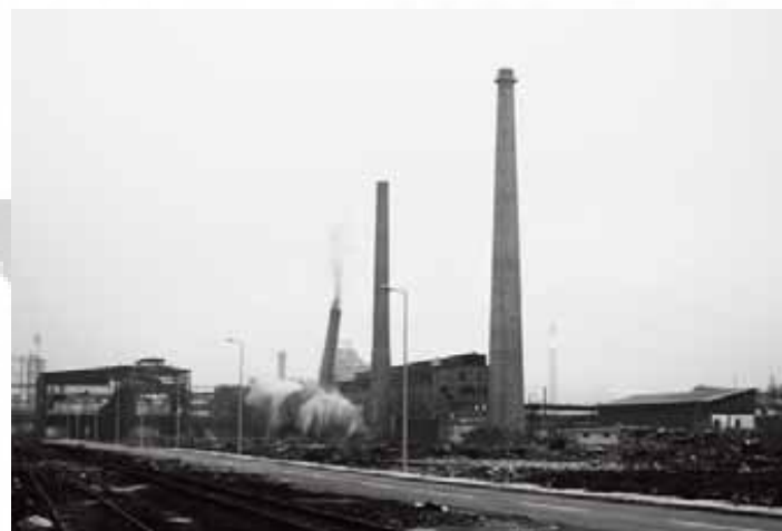
30d 16dimnjaka najveće željezare u bivšoj Jugoslaviji su srušena 2008g

Za vrijeme rata u Bosni od 1992. godine problemi s prugom i putnim komunikacijama, te činjenica da su rudnici željezne rude bili s druge strane linije fronta, sve su to bili faktori koji su uticali na prekid rada tvornice na nekoliko godina. Dijelovi tvornice su bili izloženi i bombardovanju iz zraka.