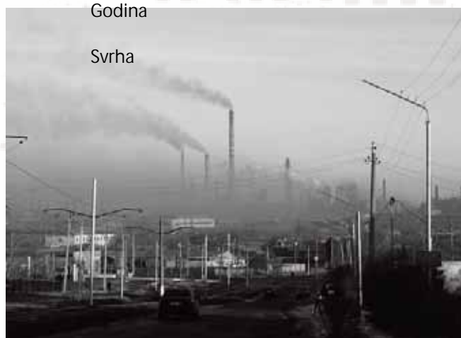
ArcelorMittal Temirtau izvozi ve i dio svog proizvoda elika, me utim lokalno stanovništvo pla a 'djenu' za to.

Gradovi Temirtau i Karaganda, ali i njihova okolina (oko 1 milion stanovnika) indirektno zavise od tvornice koja je inila približno 10% GDP Kazakhstana. Od 2006. godine zaposlila je 55.000 radnika i ostvarila 4% od GDP države.