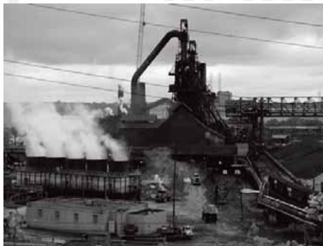
Oko ArcelorMittal Steel Cleveland željezare živi 390 000 muškaraca, žena i djece žive unutar pet milja od željezare Foto: Stefanie Spear.

1990 godine federalni amandman odredio je nove radne dozvole za emisije zraka i emisijsku naknadu na tonu emisija. Najnoviji podaci Mittal Steela emisija za 2006 godinu: 615 206kg. estica, 808 937kg. SO 2 , 1 651 488 kg. Nox, 16 819 701 kg. CO, 88 421kg. organskih kemikalija.